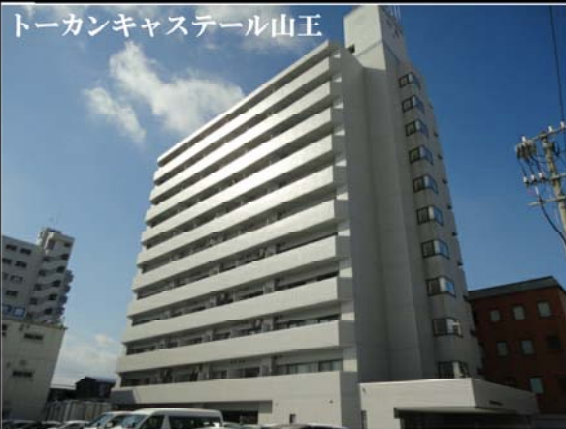
トーカンキャステール山王