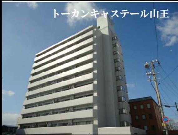
トーカンキャステール山王