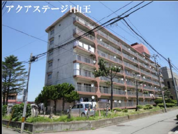
アクアステージI山王