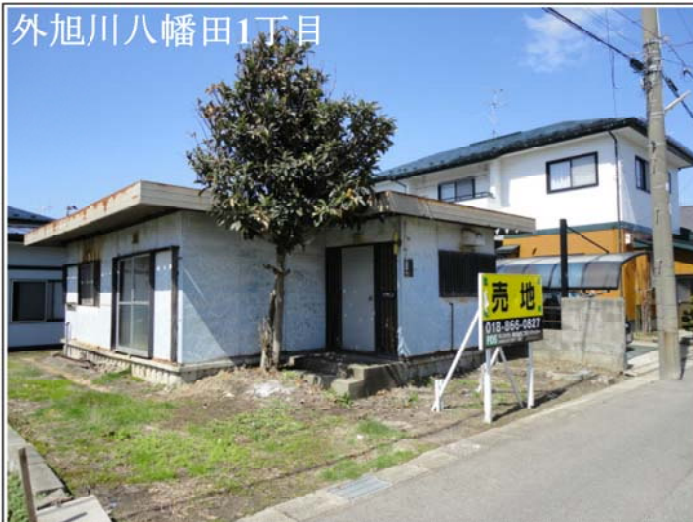
外旭川八幡田1丁目